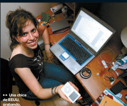
►► Una chica de EEUU, grabando.